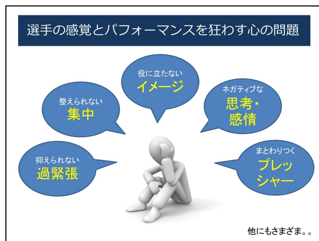
図1.選手のパフォーマンスを狂わす心の問題

強い選手、弱い選手、ジュニア選手、オリンピック選手、初級の選手、どんな選手もスポーツ競技を行っているときに心の問題に悩んでいます（図1）。また、指導者自身も悩むことがあるかもしれません。心の乱れは、いろいろなところに影響します。選手の場合、心の未熟から「試合前にドキドキして思い通りにプレーできなかった」というように、大切な試合なのに心を乱してしまって実力を発揮できなかったこともあるでしょう。また、指導者の方においても、心の乱れによって、練習中や試合中での指示や判断が適切にできなくなるといった影響があるかもしれません。